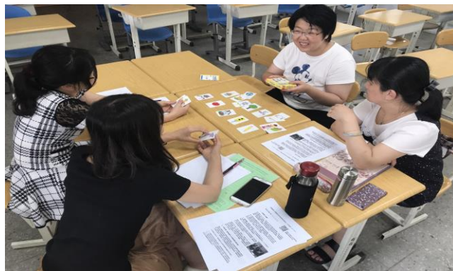
英語桌遊融入教學