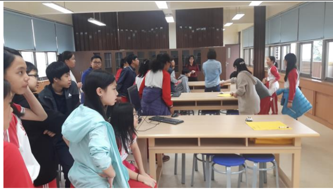
國小課程銜接學習