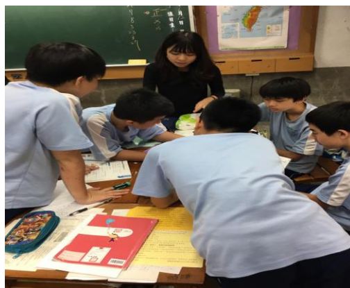
教學觀摩設計分享