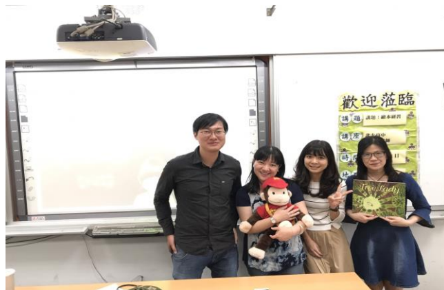
英語繪本融入教學