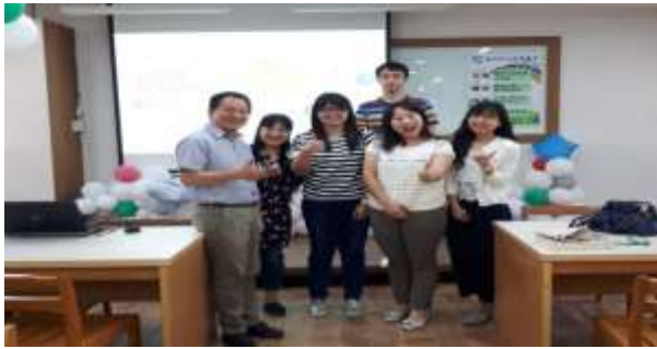
英語概念構圖訓練教學研習