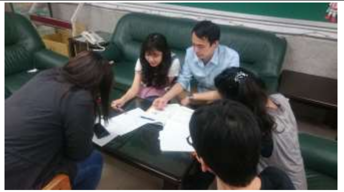
領域教學設計分享