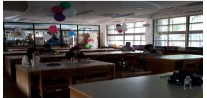
英語概念構圖訓練教學研習