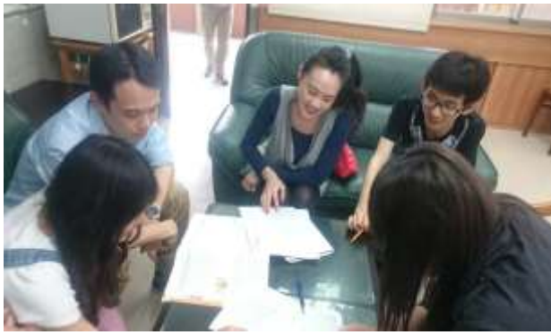
領域教學設計分享