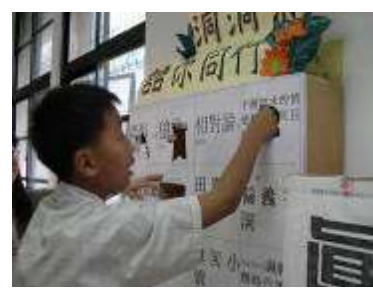
發現洞中獎品的驚奇