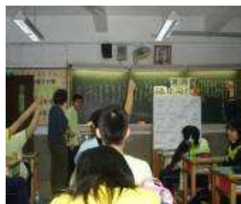
踴躍搶答三國歇後語