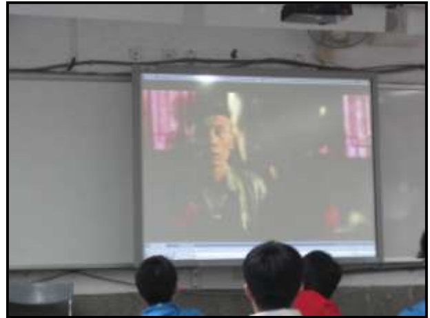
觀賞電影「活著」引導學習中華人民共和國掌權前後各階段的發展